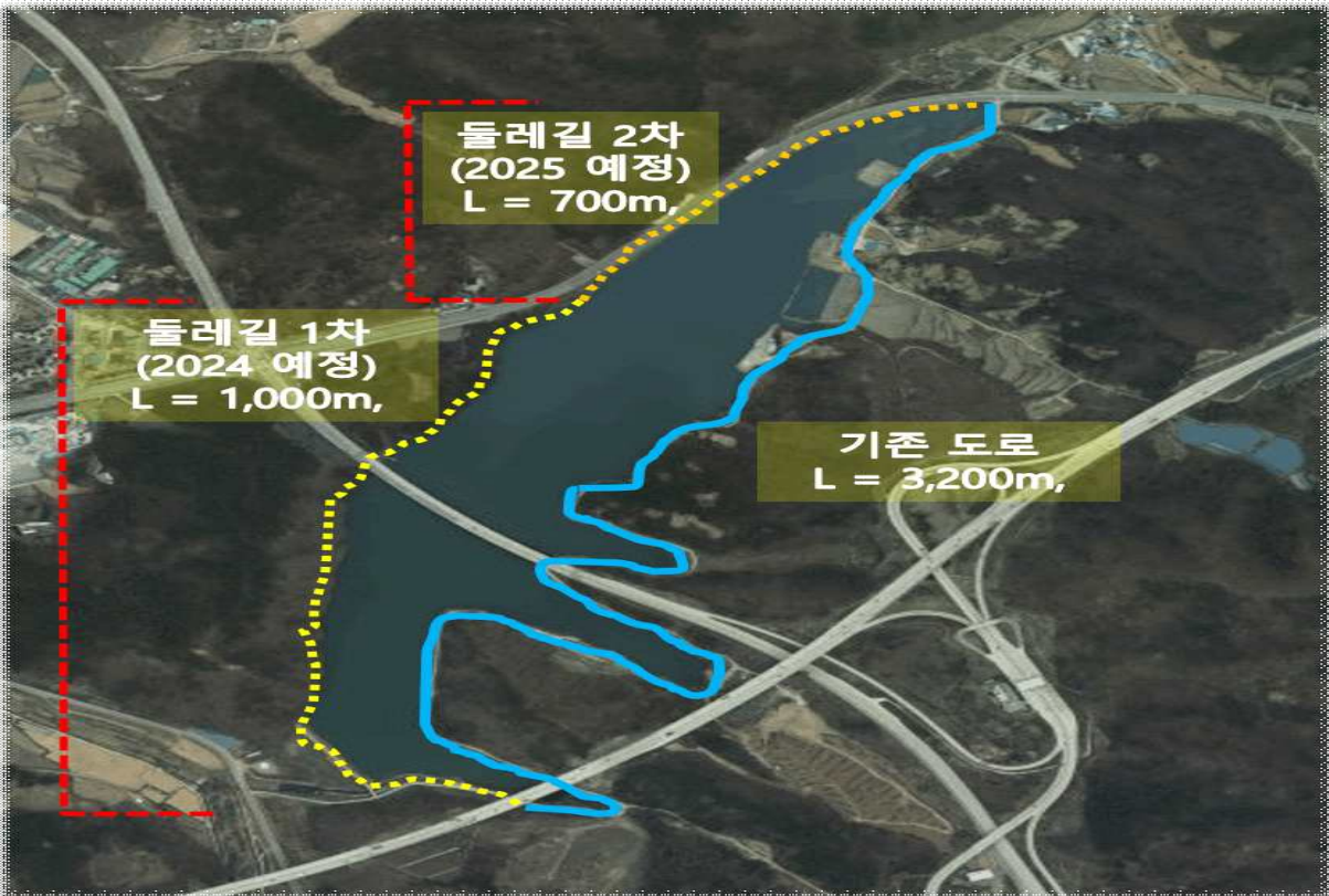
금석저수지 둘레길 조성사업