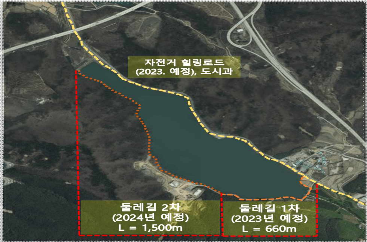
무극저수지 둘레길 조성사업